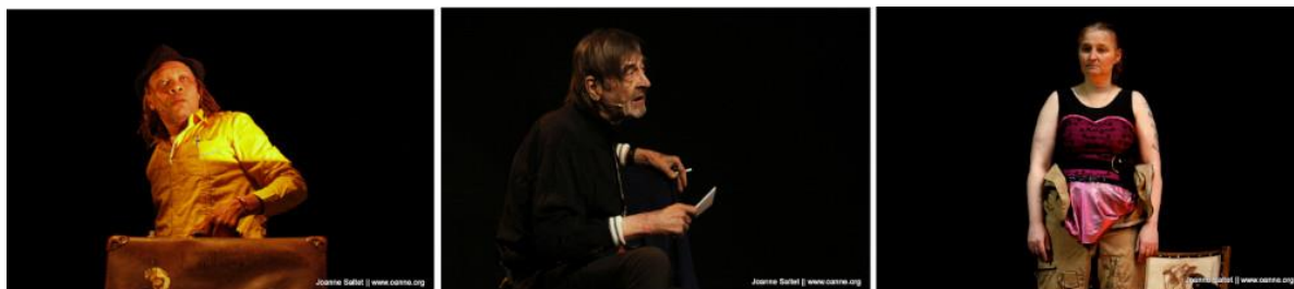
Op foto: Josef Wresenski cultuur stichting, uit theatervoorstelling Zie de mens.

Na afloop daarvan was er een ontmoeting met elkaar om het gesprek aan te gaan. Hiervan werd langdurig gebruik gemaakt door velen.